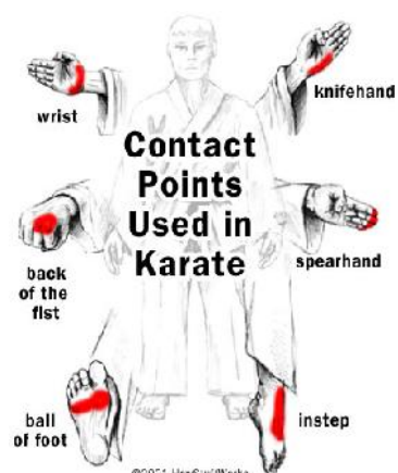
Figuur 2: Interessante raakvlakken (How Does Karate Work)

Een zelfde principe is van toepassing bij het afweren van stoten en schoppen. De beste afweer krijg je door met de pols tegen de pols (of pols tegen enkel) van de tegenstander te raken. Merk op dat hierdoor ook de mogelijkheid om de arm of been van tegenstander te grijpen en hem uit balans te trekken bestaat.